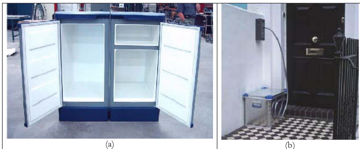
Figura 1: Caixa de recepção refrigerada (a) e com mecanismo de segurança (b)

serviço – serviço tradicional; (2ª) recepção não-assistida ( unattended ), usando um conceito de caixa de recepção, que pode ser refrigerada, instalada no muro ou na garagem da “casa” do cliente (vide Figura 1a). (3ª) recepção não atendida também usa o conceito de caixa de entrega, porém pode ser deixada na “calçada” do consumidor, retornando, depois, ao varejista. Podem ser equipadas com mecanismos de segurança, senhas etc. (vide Figura 1b). (4ª) recepção não-assistida que usa unidades compartilhadas de recepção ( shared reception box units ), também conhecida por CDP ( Collection and Deliveri Point ), existe em vários tamanhos e quantidades, muitas das quais também podem dispor de sistema de refrigeração em alguns de seus compartimentos. Os vários armários possuem chaveamento eletrônico com códigos variáveis, tornando sua disponibilidade possível com o uso, inclusive de celulares. Podem ser disponibilizados em supermercados, estações de trem e ônibus, escritórios, estacionamentos, ou onde o varejista julgar interessante ao cliente (a Figura 2 mostra exemplos desse tipo de serviço). Esse mecanismo pode ser referenciado como um sistema automatizado (outras empresas empregam esse mesmo conceito, porém com sistemas totalmente automatizados – ADMs, Figura 2d).